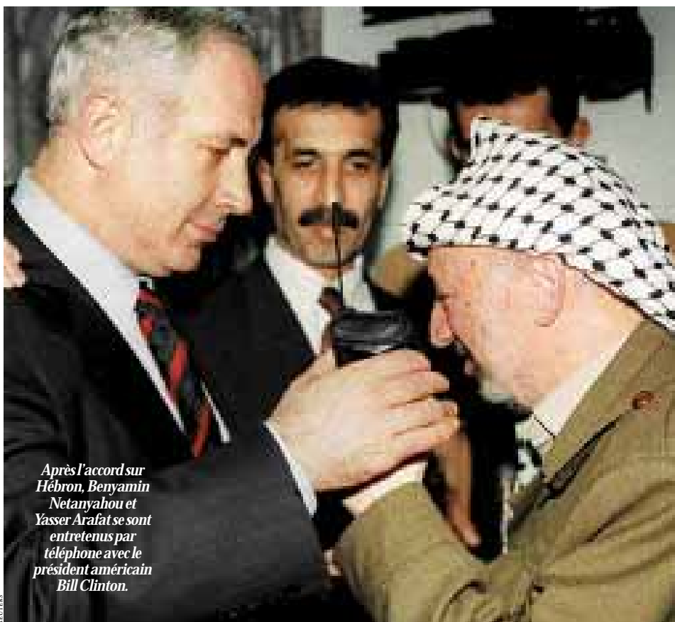
Après l'accord sur Hébron, Benjamin Netanyahu et Yasser Arafat se sont entretenus par téléphone avec le président américain Bill Clinton.

Israéliens et Palestiniens ont conclu, dans la nuit de mardi à mercredi, un accord sur Hébron où l'armée israélienne doit évacuer 80% de cette ville de Cisjordanie. Cet accord redonne un peu d'oxygène au processus de paix initié par les accords d'Oslo. Mais sa mise en œuvre suscite encore de nombreuses interrogations. Page 2