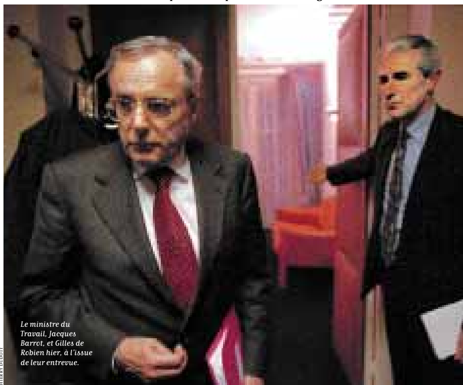
Le ministre du Travail, Jacques Barrot, et Gilles de Robien hier, à l'issue de leur entrevue.

«Les modalités de la loi ne changeront pas», a assuré hier Gilles de Robien (UDF) après avoir rencontré Alain Juppé et Jacques Barrot. Depuis jeudi, ministres et parlementaires de la majorité ont multiplié les critiques contre cette loi «coûteuse» qui accorde des réductions de charges sociales aux entreprises acceptant de diminuer le temps de travail pour embaucher. Page 2