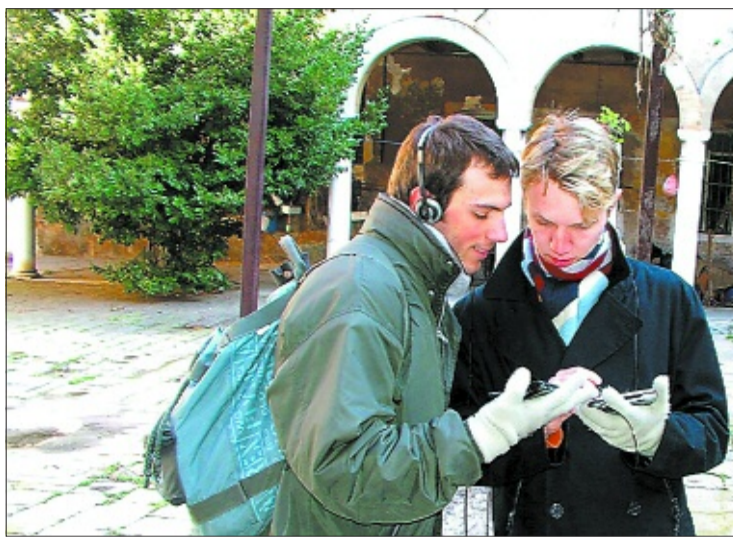
History Unwired proporciona visitas personalizadas y multimedia por Venecia.

Un proyecto innovador, presentado en Venecia durante la Bienal de Arte, utiliza tecnologías móviles para guiar al turista por monumentos y callejuelas. Una visita personalizada y gratuita durante octubre.