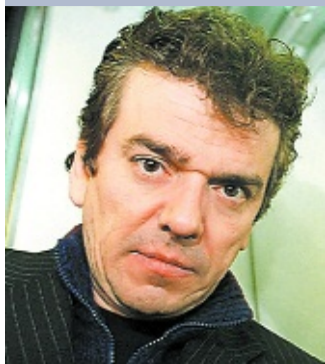
JAIME URRUTIA CANTANTE